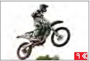
جشنواره فرهنگی ورزشی در کنار کارون