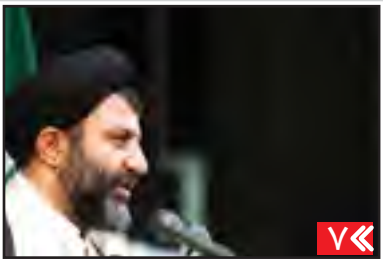
درخشش در جشنواره فرهنگی هنری امام رضا