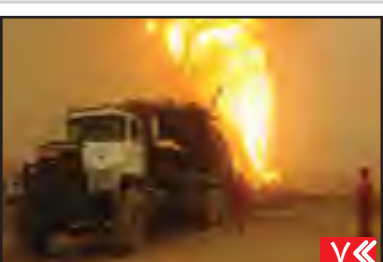
فیلم سازان خوزستان در تهران